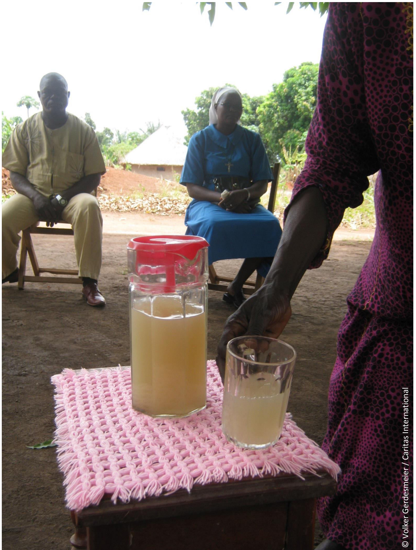
„Trinkwasser“ im Südsudan