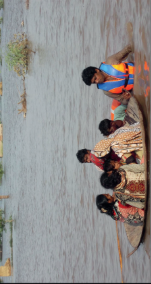
Flut in Pakistan