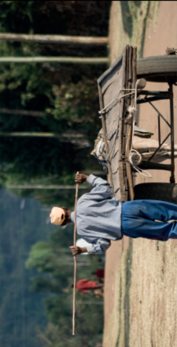
Vertreibung der Bauern